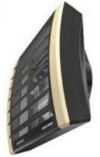
Тепловые электро-водяные воздушные завесы DEFENDER, ТЕПЛОМАШ и воздушонагреватели VOLCANO