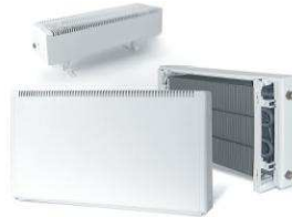
Классические медно-алюминиевые конвекторы ИзоТерм М