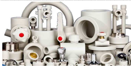
Полипропиленовые трубопроводы Wavin ЕКОPLASTIK