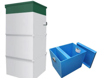
БиоСептики ЕвроБион Жироуловители EvoStok