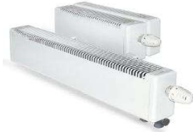
Стальные конвекторы NOVOTERM НовоТерм Медно-алюминиевые конвекторы с терморегуляторами ИЗОТЕРМ isotherm, EcoTerm ЭкоТерм, CORALL Коралл