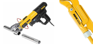
Сантехнический инструмент REMS, BRINKO