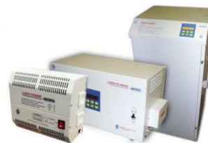
Электронные стабилизаторы напряжения PROGRESS, LIDER