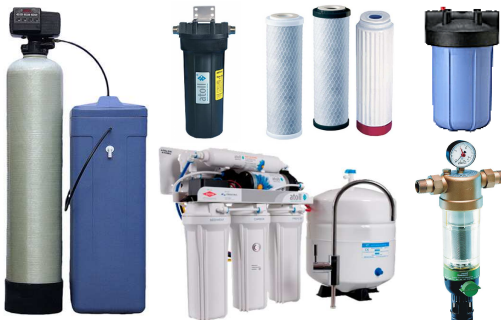
Фильтры, Картриджи, Водоподготовка, УФ-обеззараживатели, Баллоны, Управляющие клапаны, Реагенты, Засыпки