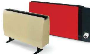
Медно-алюминиевые дизайн-конвекторы ATOLL, ATOLL Pro, RODOS