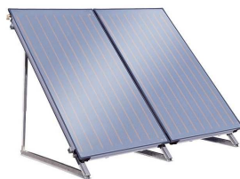
Солнечные водонагреватели (коллекторы) BOSCH, SAPUN, ЯSOLAR