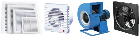
Вентиляционные решетки, Воздуховоды, Вентиляторы VENTS, CATA