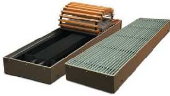
Медно-алюминиевые конвекторы встраиваемые в пол GOLFSTREAM гольфстрим "внутрипольные радиаторы" с естественной и принудительной конвекцией. Фасадные конвекторы, Конвектор-скамья