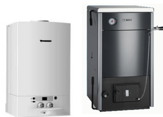
Настенные и напольные котлы, бойлеры, горелки BOSCH, DRAZICE, ACV, BUDERUS, LAMBORGHINI, PROTHERM