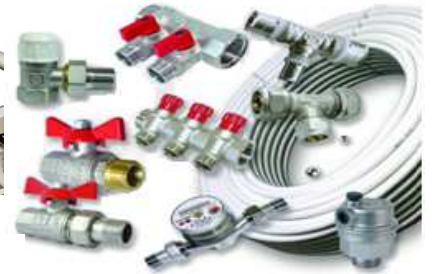
Металлопластиковые системы и запорно-регулирующая арматура VALTEC, VALSIR MIXAL