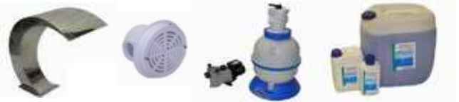
Бассейновое оборудование и комплектующие. Химия для ухода за водой бассейнов BAYROL .

АКВАМАСТЕР гк г.Краснодар, ул. Колхозная, 53/2 www.aquamaster.net.ru info@aquamaster.net.ru КОТЛЫ. РАДИАТОРЫ. КОНВЕКТОРЫ. ТРУБЫ. НАСОСЫ. АРМАТУРА. КИПИА. СТАБИЛИЗАТОРЫ. БОЙЛЕРЫ. ГОРЕЛКИ. ФИЛЬТРЫ. ВОДОПОДГОТОВКА. БиоСЕПТИКИ. БАССЕЙНЫ. ИЗОЛЯЦИЯ. ВЕНТИЛЯЦИЯ. САНТЕХНИКА. Розница: +7 (861) 279-04-00, моб. megafon +7 928 660-01-86, ОПТ: +7 (861) 279-10-01, моб. mts +7 988 602-60-48