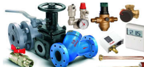
Запорно-регулирующая арматура и автоматика CALEFFI, FAR, ESBE, DANFOSS, ITAP, SIEMENS, HONEYWELL, MEIBES