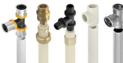
Полипропиленовые системы Wavin ЭКОPLASTIK экопластик Чехия, VALTEC валтек, Пластиковые и Металлопластиковые трубы VALSIR, VALTEC, REHAU, SANEXT