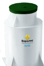
Автономная канализация EUROLOS , Жироуловители EvoStok , Канализация HL, OSTENDORF, AlcaPlast, Viega