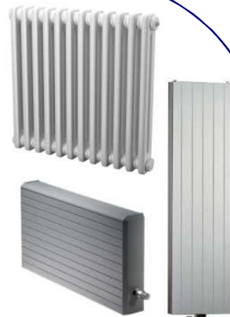
Стальные трубчатые и плоские дизайн-радиаторы ARBONIA арбония, IRSAP, Zehnder, PURMO пурмо, JAGA яга