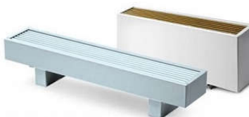
Медно-алюминиевые дизайн-конвекторы CORALL Коралл