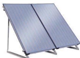
Солнечные вакуумные и плоские водонагреватели (коллекторы)