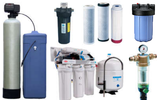
Фильтры для воды, Картриджи, Засыпки и Реагенты, Соль таблетированная, Умягчители, Водоподготовка и обратный Осмос, УФ-обеззараживатели