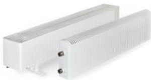
Стальные конвекторы НОВОТЕРМ novoterm