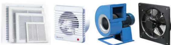
Вентиляционные решетки, Воздуховоды, Вентиляторы, Рекуператоры VENTS, CATA, BLAUBERG