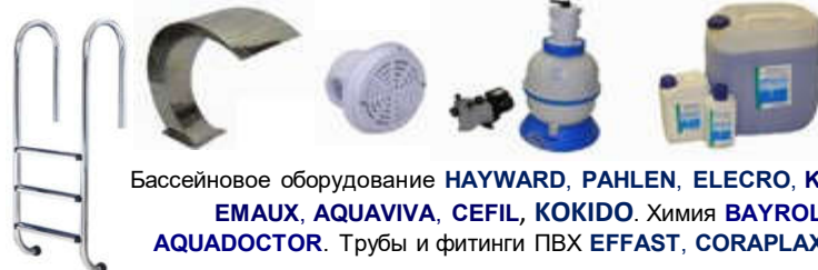
Бассейновое оборудование HAYWARD, PAHLEN, ELECRO, KRIPSOL, EMAUX, AQUAVIVA, CEFIL, KOKIDO . Химия BAYROL, AQUADOCTOR . Трубы и фитинги ПВХ EFFAST, CORAPLAX, ERA

АКВАМАСТЕР гк г. Краснодар www.aquamaster.net.ru info@aquamaster.net.ru КОТЛЫ. РАДИАТОРЫ. КОНВЕКТОРЫ. ТРУБЫ. НАСОСЫ. АРМАТУРА. КИПИА. СТАБИЛИЗАТОРЫ. БОЙЛЕРЫ. ГОРЕЛКИ. ФИЛЬТРЫ. ВОДОПОДГОТОВКА. БиоСЕПТИКИ. БАСЕЙНЫ. ИЗОЛЯЦИЯ. ВЕНТИЛЯЦИЯ. САНТЕХНИКА. Telegram Viber WhatsApp: megafon +7 928 660-01-90, mts +7 988 602-60-48 +7 (861) 279-10-01