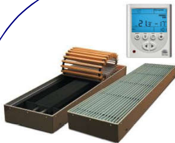
Конвекторы встраиваемые в пол, с естественной и принудительной конвекцией GOLFSTREAM гольфстрим