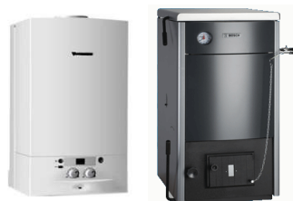
Настенные и напольные Котлы, Бойлеры, Горелки DRAZICE, ACV, BUDERUS, LAMBORGHINI, PROTHERM, VAILLANT, BAXI, NAVIEN